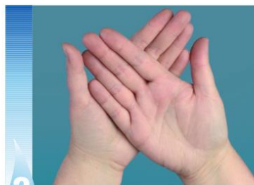
2 Nuddið bæði handarbökin með lófunum