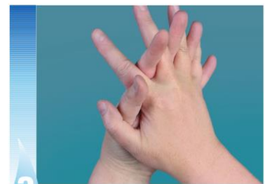
3 Nuddið vel milli fingra