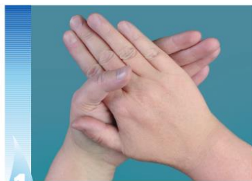
1 Nuddið lófum saman

Endurtakið hvert atriði vandlega fimm sinnum eða oftar!