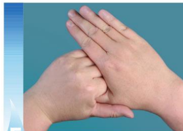
5 Nuddið báða þumalfingur vandlega