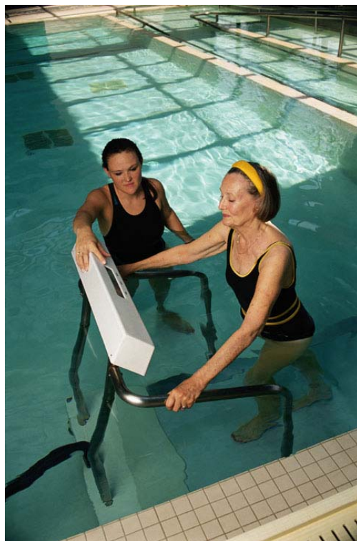
ICF flokkunarkerfið er til þess ætlað að skrá fötlun, færni og heilsu á samræmdan hátt.

Drög að þýðingu ICF hafa verið í kynningu á vef Landlæknisembættisins, www.skafi.is , síðastliðið ár samhliða því sem kallað hefur verið eftir ábendingum er lúta að orðum og hugtökum í kerfinu.