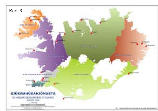
Kort 1. Heilsugæslustöðvar og heilsugæslusel. Kort 2. Stofnanir með hjúkrunarrými. Kort 3. Sjúkrahúsþjónusta. Smellið á myndirnar til að skoða stærri kort.