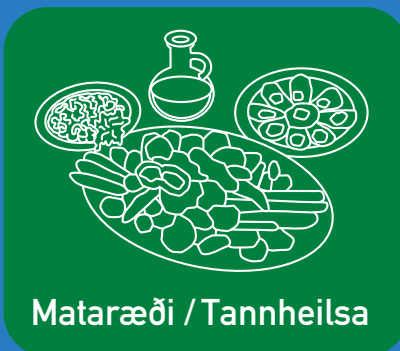
Mataræði / Tannheilsa