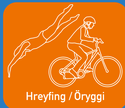
Hreyfing / Öryggi