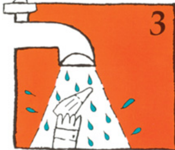
3 (Settu tappann í vaskinn) Ef tönnin er óhreín, skolaðu hana þá örstutt með köldu rennandi vatni