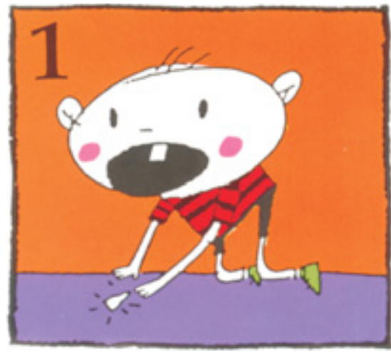
1 Finndu tönnina strax!