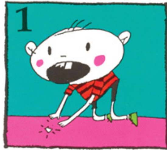
1 Finndu öll tannbrotin