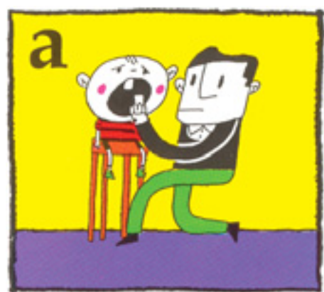
a Ef þetta er fullorðinstönn reyndu þá að setja tönnina aftur í holuna