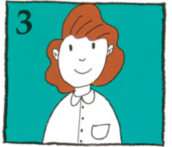
3 Til þess að það sé hægt farðu STRAX til tannlæknis