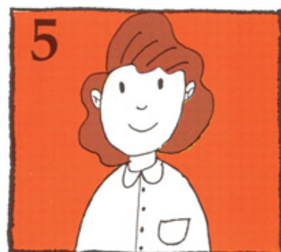
5 Farðu STRAX til tannlæknis. Best er að komast til tannlæknis á innan við klukkutíma

Athugið að leita ávallt ráða hjá tannlækni sem fyrst eftir alla áverka á tennur.