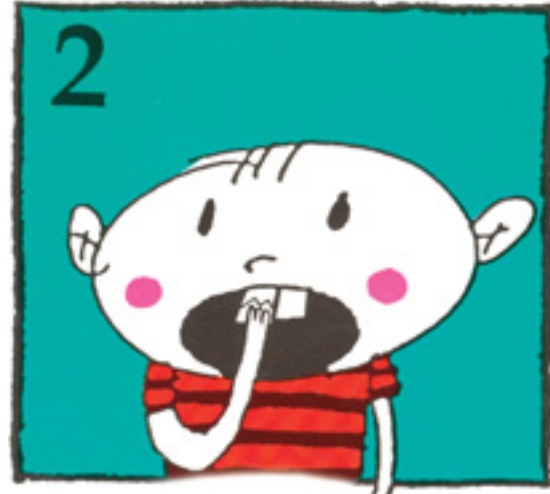
2 Oftast er hægt að líma þau á tönnina