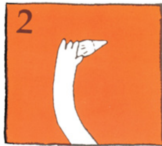
2 Haltu aðeins um tannkrónuna, ekki rótina